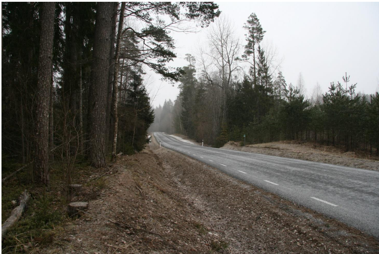
Foto 4. Salaviina tee ristumine riigiteega, vaade vasakule. 30.03.2023