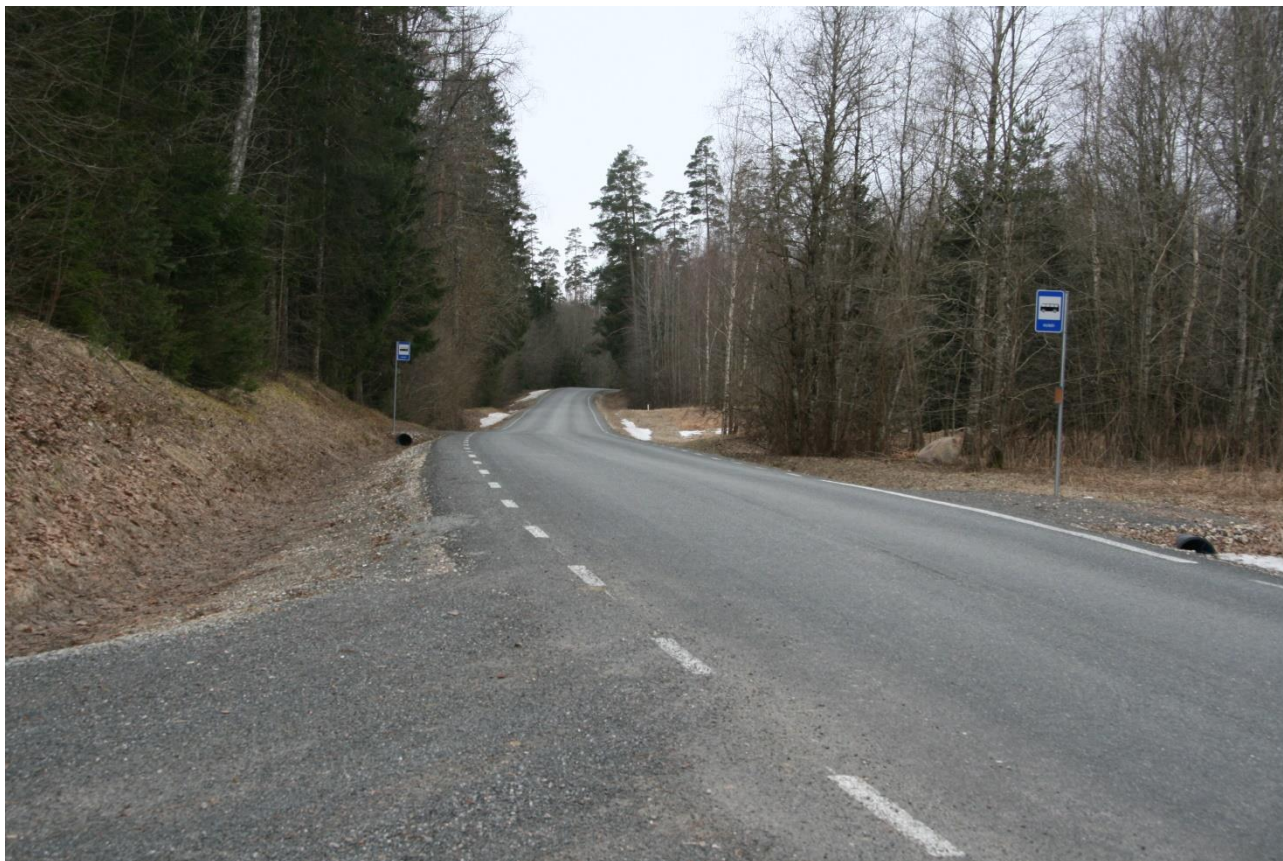
Foto 2. Patupera-Saare tee ristumine riigiteega, vaade vasakule. Allikas: OÜ Reaalprojekt 30.03.2023