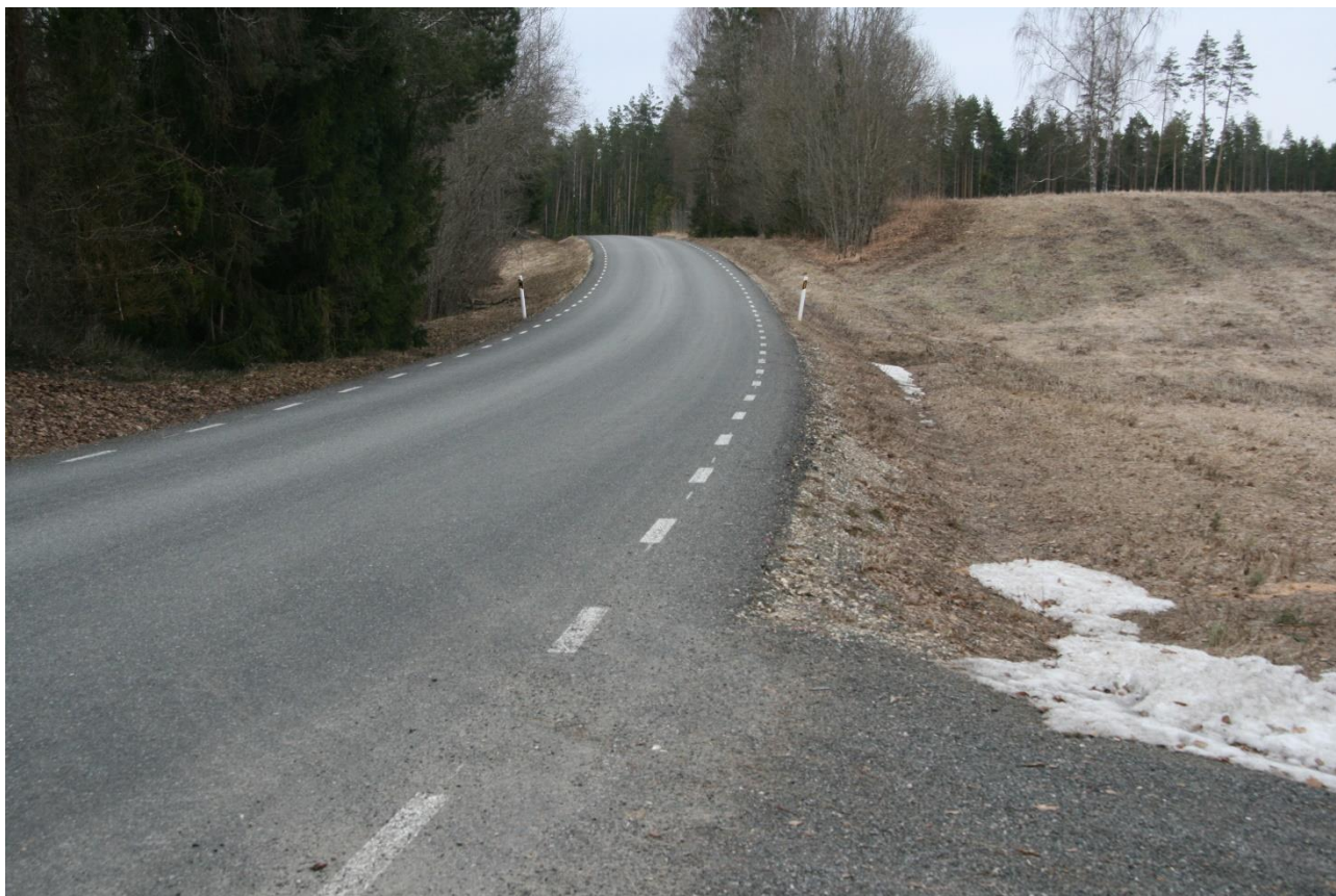
Foto 1. Patupera-Saare tee ristumine riigiteega, vaade paremale.