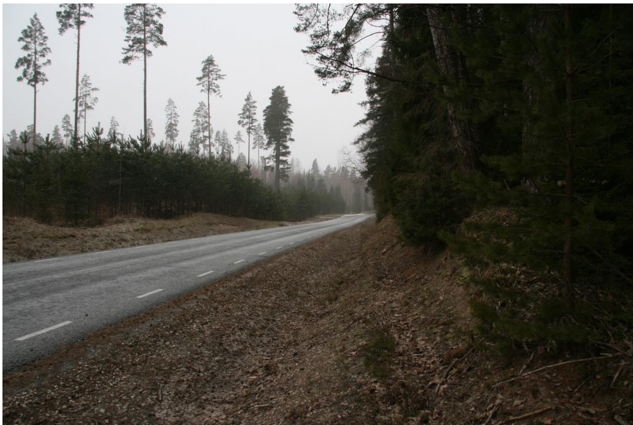
Foto 3. Salaviina tee ristumine riigiteega, vaade paremale. 30.03.2023